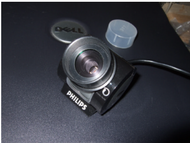
PHILIPS SPC900NC + 800nm < カットフィルター