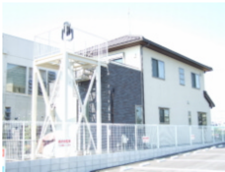
コンクリート支柱 (4.5m)と 観測台とは基礎縁切り