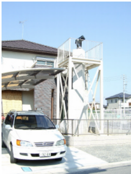
観測台 2m x 2m